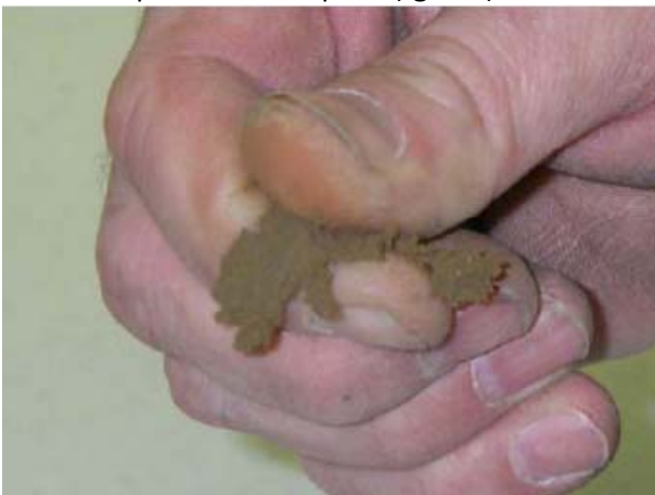
Ilovasto mogu se napraviti trake do 2,5 cm ( tgr = 2 )