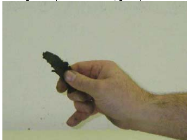
Srednje teška glina mogu se napraviti trake >5cm ( tgr = 4 )