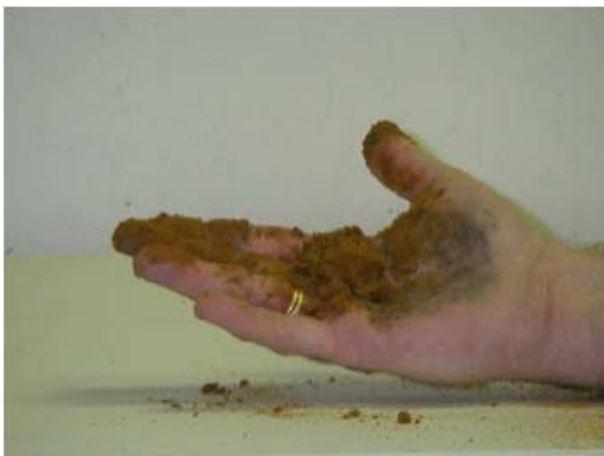
Lako pjeskovito stisnuta loptica tla se raspada ( tgr = 0 )