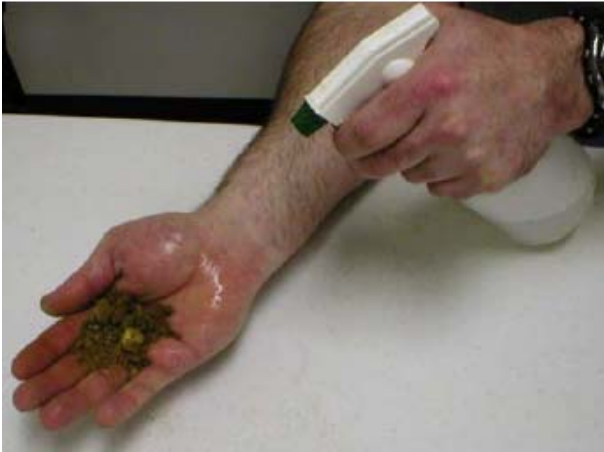
Pokvasiti tlo s malo vode tako da se može "modelirati"