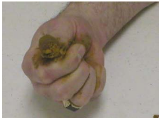
Lako ilovasto ne mogu se napraviti trake tla ( tgr = 1 )