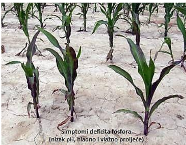
Slika 1. Simptom deficita fosfora na kukuruzu u uvjetima niskog pH tla, "hladnog" i "vlažnog" proljeća

Startna gnojiva su najkorisnija kada se sjetva/sadnja obavlja u hladnim i vlažnim tlima, u rano proljeće ili kasnu jesen, bez obzira na plodnost tla. Primjena starter gnojiva osobito je važna u konzervacijskim sustavima obrade. Usjevi sijani u kasno proljeće ili ranu jesen uglavnom ne zahtijevaju starter gnojiva, osim ako je plodnost tla niska pa u ranom porastu biljke nemaju