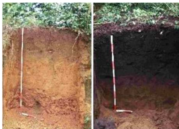
Slika 1. Lijevo: Boja tla niske plodnosti ( ferozem ; oxisol ); desno: poboljšanje ferozema dodatkom biougljena

Biougljen može biti praškast, zrnat ili briketiran, a primjenjuje se u dozama od 0,5 do 135 tona po hektaru (izmiješan s tlom, u kontejnerima s presadnicama, jamama za sadnju voća i dr.) i u tom rasponu se postiže često značajno povećanja prinosa (prosječno 15 - 20 %), posebice na kiselim, lakim i slabohumoznim tlima. Zbog njegove rezistentnosti, odnosno vrlo spore oksidacije u tlu, njegova djelotvornost proteže se na velik broj godina (1300 - 4000 god.). Biougljen sadrži 60 - 82,5 % ugljika, ovisno o biološkom materijalu iz kojeg je