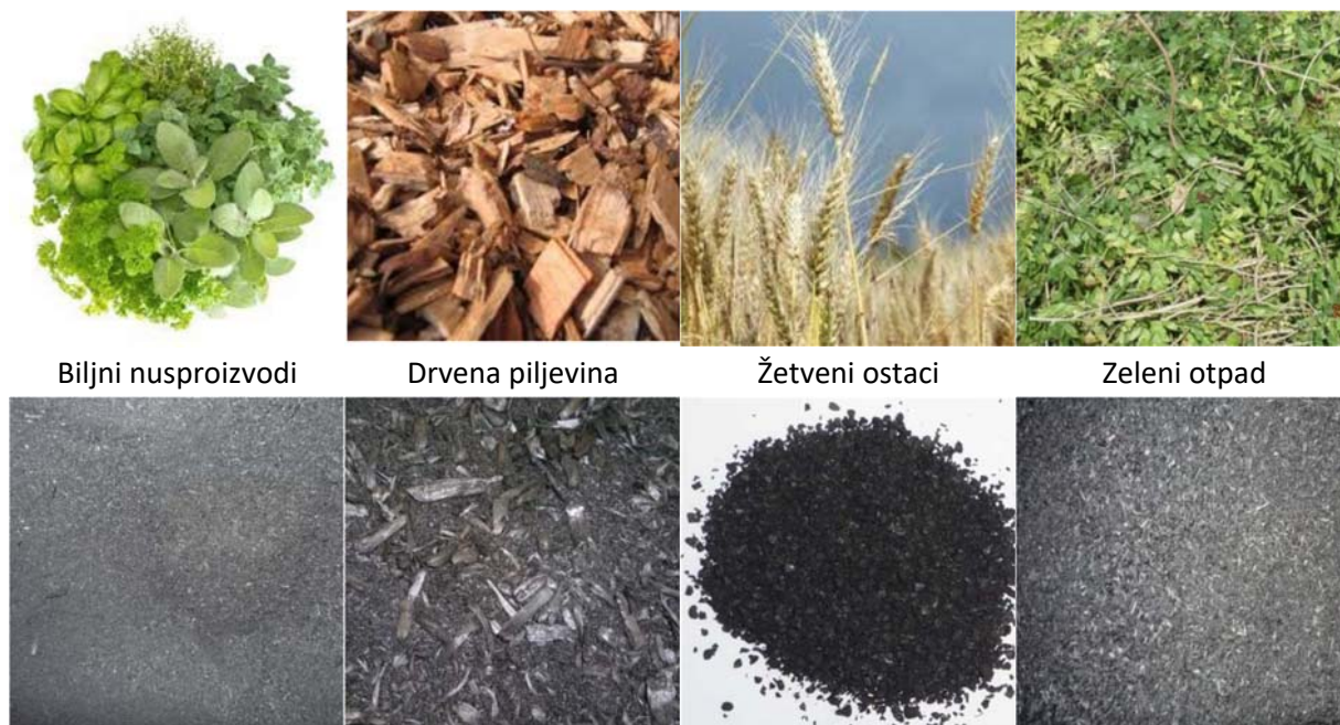
Tablica 1. Svojstva i izgled biougljena određen je biomasom za njegovo dobivanje (Biogreen®)

Proizvodnjom biougljena iz organskog otpada dobiva se tvar finozrnate je strukture i iznimne poroznosti što povećava plodnost, posebice kiselih tala, vežući kisele katione, uključujući i hranjive elemente. Time zadržava hraniva u zoni korijena, odnosno sprječava ispiranje hraniva iz rizosfere , povećava kapacitet tla za vodu ( retencija vode ) te smanjuje potrebu navodnjavanja, a primjena pesticida je učinkovitija. Primjena biougljena potpomaže bolje zagrijavanje tla zbog njegove tamnije boje (Slika 1.), utječe na poboljšanje strukture tla, povećava kvalitetu podzemnih voda zbog učinkovitog filtriranja otopljenih nečistoća itd. Također, važno je istaći da se proizvodnjom biougljena efikasno smanjuje neto količinu ugljičnog dioksida (tzv. sekvencijacija ) u zraku (koji se također smatra „stakleničkim plinom“).