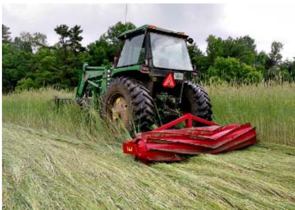
Slika 2. Valjanje prethodnog usjeva