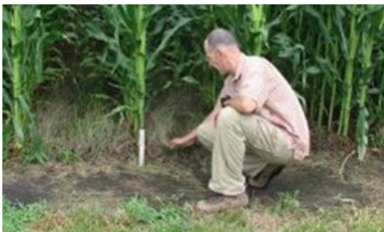
Slika 4. Višegodišnja trava unutar kukuruza ( https://www.agronomy.org/science-news/corn-cover-grass )

Prethodni usjevi, preko kojih se usijava, moraju biti potpuno uništeni prije komercijalnih usjeva, što često zahtijeva višestruki prijelaz valjkom.