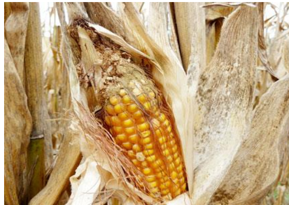
Slika 1. Aspergillus flavus na klipu kukuruza

Nekoliko usjeva, uključujući kukuruz, pogođeni su infekcijom kozmopolitski rasprostranjenom gljivicom Aspergillus flavus , čiji pojedini sojevi proizvode visoku koncentraciju aflatoksina opasnog za životinje i ljude. Smatra se da se time uništi 25 % ili više globalno proizvedene hrane . Gljivicama iz roda Aspergillus pogoduje visoka temperatura i visoka vlažnost te visok osmotski tlak supstrata ( ugljikohidrata ) i visoka koncentracija kisika. Stoga Aspergillus spp. najčešće raste kao plijesan na supstratu bogatom ugljikom, odnosno ugljikohidratima ( monosaharidima , kao što je glukoza ili polisaharidima poput amiloze ) te se često razvija i na klipovima kukuruza (Slika 1.), krumpiru, kruhu itd. Usjevi mogu biti kontaminirani prije i nakon berbe. U prirodi se javlja 14 vrsta aflatoksina , ali su B1, B2, G1 i G2 posebno opasni za ljude i životinje jer su najčešći u hrani.