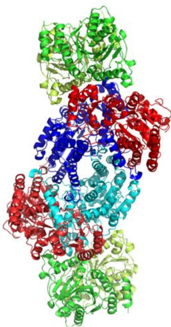
Slika 3. Struktura enzima nitrogenaze

Sve cijanobakterije su fotosintetski (autotrofni) organizmi koji energiju Sunca akumuliraju u energetski bogatim spojevima, kao što je ATP, koji omogućuju sintezu složenih organskih spojeva iz CO_2 i H_2O , prvo šećera, a zatim i drugih spojeva, pri čemu bjelančevine uključuju pored ugljika, kisika i vodika i dušik (poneke i sumpor). Također, energetske potrebe za fiksaciju molekularnog dušika izuzetno su visoke (1 mol glukoze/1 mol N_2 ). Stoga je fiksacija molekularnog dušika unutar kloroplasta zbog visokih zahtjeva za energijom, ali i veoma složen jer se u procesu fotosinteze oslobađa kisik cijepanjem vode ( fotooksidacija ) koji koči aktivnost enzima nitrogenaze u tom fiziološkom procesu (Slika 2. i 3.). Naime, nusprodukt fotosinteze je kisik, a on je toksičan za nitrogenazu. Problem je moguće riješiti odvajanjem ta dva procesa ili vremenski odvajanjem tako da se fotosinteza odvija danju, a fiksacija dušika noću u anaerobnim uvjetima, odnosno kad se sav kisik u stanicama potroši u procesu disanja.