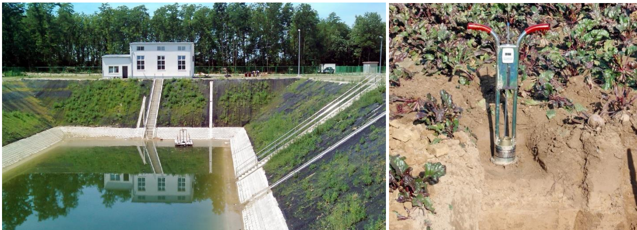
Slika 3. Crpna stanica Belišće-Gat (lijevo), mjerenje infiltracije vode (desno) na području Gata

trostruko nižu cijenu od ulaganja u sustav za navodnjavanje po hektaru. Slični, samo veći sustavi za navodnjavanje izgrađeni su u Baranji (mogućnost navodnjavanja 5000 ha) i Kapinci-Vaška (1.280 ha), ali se također vrlo slabo koriste, što zbog nepoznate cijene priključka i vode, što zbog skupe opreme, a najčešće zbog što su takvi sustavi isplativi isključivo u profitabilnoj proizvodnji, npr., voće, povrće, cvijeće, sjemenska proizvodnja i sl. Također, izrađeni su i planovi navodnjavanja po županijama te nacionalni master plan navodnjavanja u koje su utrošeni ogromna sredstva, a bez realne i praktične/izvedbene vrijednosti za poljoprivrednu proizvodnju. Stoga prije investicije u hidrotehničke zahvate treba stručno i odgovorno elaborirati opravdanost takvog ulaganja i razmotriti neke od jeftinijih, ali učinkovitih agrotehničkih mjera.