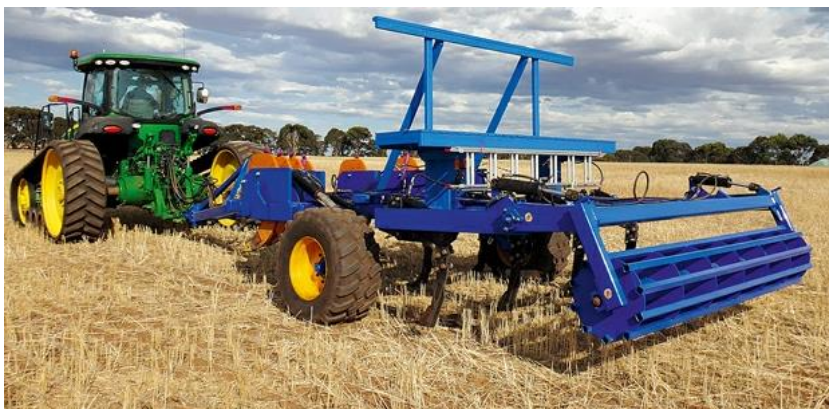
Slika 4. Podrivač (DAFWA, Australia) s dvije dubine (300 mm naprijed i 600 mm pozadi) s depozitorima za vapno ili gips

Dubinsko rahljenje učinkovita i ekonomična zamjena je za osnovnu obradu tla plugom jer pored rahljenja tla uklanja se eventualno prisutan taban pluga , odnosno tanjurače, znatno povećava volumen tla i njegova sposobnost zadržavanja vode i efikasno uništavaju korovi dubokog korijena (npr. sirak, trska i dr.), tvrdi dr. sc. Ivan Musa (Slika 3.). Budući da se rahljenjem ne prevrće humusno akumulativni sloj, tlo nakon obrade prekriveno je biljnim ostacima usjeva i korova, uključujući i sjeme korova koje ostaje na površini i time izloženo jačem propadanju. Kad bi prikazani prototip dubinskog razrahljivača imao depozitore mineralnog ili organskog gnoja, karbokalka i sl. što je moguće nadograditi (Slika 4.), razrahljivač bi mogao biti kompletna zamjena za osnovnu obradu tla.