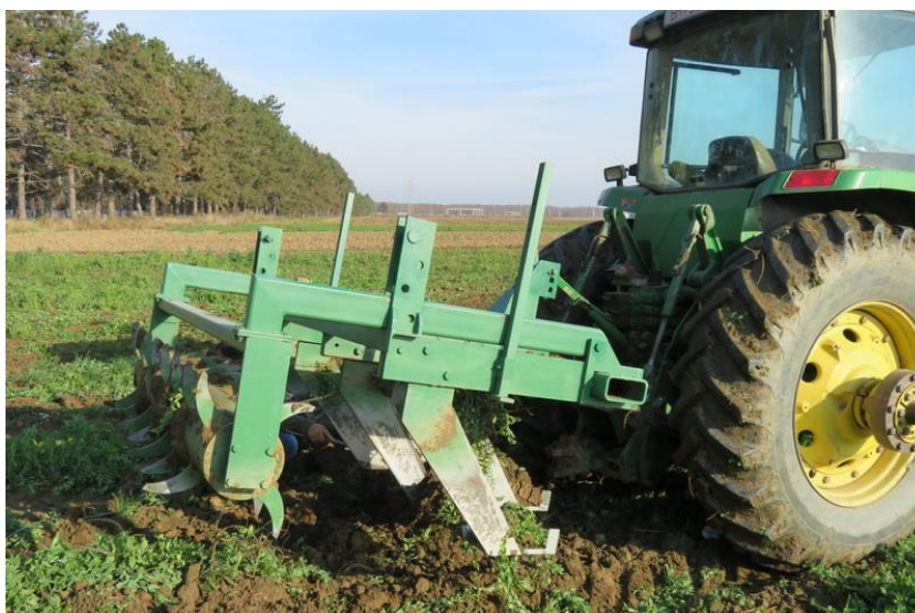
Slika 3. Dubinski razrahljivač ( prototip, dr. Ivan Musa )

Ovakva istraživanja ipak treba uzeti s velikom rezervom jer se odnose na posve različite edafske (zemljišne) i agroekološke uvjete u odnosu na ist. Hrvatsku. Naime, nedavno provedena meta-analiza čak 610 studija izvedenih u različitim dijelovima svijeta pokazala je da se samo u suhim klimatskim uvjetima no-till uz zadržavanje žetvenih ostataka i rotaciju usjeva povećava produktivnost usjeva. Međutim, u Europi, zbog više vlage u tlu uz nultu obradu prinos je bio prosječno niži za sve usjeve 8,5%, dok uzgoj šećerne repa nije bio ekonomski održiv bez obrade tla. Također, niti konzervacijska obrada zbog humidnije klime u većem dijelu Europe, nije se pokazala boljom od konvencionalne, te je različite sustave reducirane, konzervacijske i no-till obrade potrebno prvo provjeriti u našim proizvodnim uvjetima.