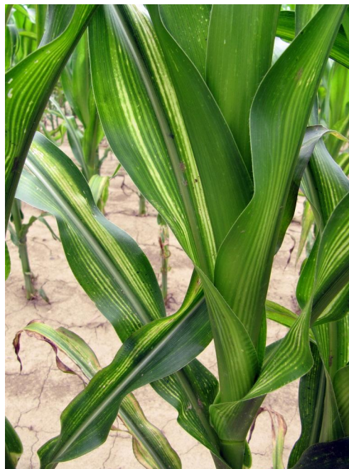
Slika 3. Tipičan izgled simptoma deficita cinka na kukuruzu

Tekst se temelji na e-knjizi „ Tlo, gnojidba i prinos “ (Vladimir & Vesna Vukadinović, 2016.)