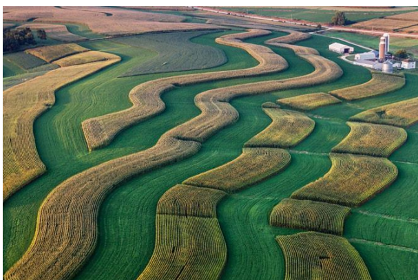
Slika 3. Naizmjenična sjetva u trake kukuruza soje i lucerne na farmi u Wisconsinu, SAD

kvantitativna analiza biljnih fenotipova (struktura i funkcija biljaka) predstavljaju još uvijek usko grlo povećanja biljne produkcije.