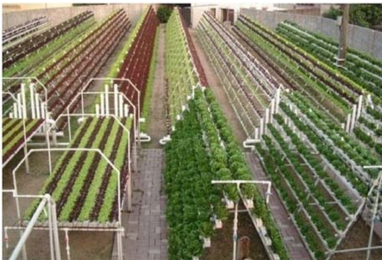
Slika 3. Različiti aeroponski sustavi uzgoja biljaka

Koncentracija CO 2 mijenja se unutar usjeva u konvencionalnom uzgoju ovisno o intenzitetu njegove asimilacije te je preko dana, u prizemnom dijelu atmosfere, prosječno za 12 % niža, a često unutar usjeva pada i na 0,01 %, posebno kad nema vertikalnog strujanja zraka ( konvekcija ). To kod biljaka s C-3 tipom fotosinteze lako dovodi biljke u tzv. kompensacijsku točku (intenzitet fotosinteze jednak je intenzitetu disanja, tj. količina usvojenog CO 2 jednaka je količini izdvojenog O 2 ), pri čemu raste intenzitet fotorespiracije (usvajanje kisika uz oslobađanje CO 2 na svjetlosti) pa je prirast suhe tvari često jako umanjen. Usjevi tijekom