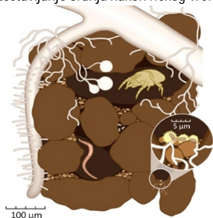
Slika 3. Organomineralni kompleks tla kao temelj strukture

Obrada tla, posebice oranje, ravnjanje, kultivacija i dr., mehaničko je zadiranje u pedosferu i dovodi do manjeg ili većeg premještanja površinskog sloja, pa inzistiranje na centimetarskoj preciznosti (npr. korištenjem diferencijalnog GPS-a) za uzorkovanje tla nema smisla. Također, reducirana obrada, grebenasto oranje (slogovi) ili izostavljanje oranja nakon nekog vremena značajno utječu na slojevitost tla ( stratifikacija ), npr. raslojavanje