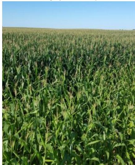
Slika 2. Vizualna razlika Envita® tehnologije i netretiranog kukuruza u Minnesoti (SAD)

Suvremena poljoprivreda veoma je ovisna o fosilnim energetskim resursima (ugalj, nafta i plin), kako u izravnoj potrošnji (uzgoj usjeva),