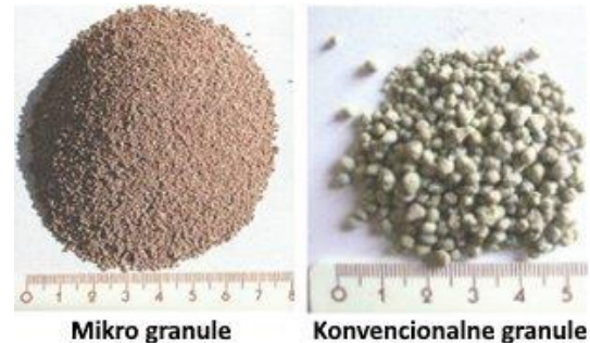
Slika 1. Veličina mikro i konvencionalnih granula mineralnih gnojiva

Konvencionalna granulirana mineralna gnojiva imaju promjer granula 2,5 - 4,5 mm, dok su mikro granulirana gnojiva (ili mikro zrnasta) znatno manjeg promjera, svega 0,5 -1,2 mm (87 % je promjera između 0,5 i 1,0 mm, Slika1.) . Mikro granulirana gnojiva dizajnirana su za lokaliziranu primjenu te nesmetano prolaze za vrijeme aplikacije kroz cijevi do depozitora u tlu odmah pored, ili ispod sjemena, jer imaju sitne i glatke granule, teško se mrve (ne sadrže prašinu), što uz jednostavno rukovanje omogućuje precizno doziranje hraniva u blizini sjemena, odnosno korijena (Slika 2.). Mikro granularnih gnojiva ne mogu se primjenjivati standardnim depozitorima zbog malog promjena granula, primjene puno manje doze te nedovoljne preciznosti polaganja gnojiva u tlo standardnim uređajima. Mogu sadržavati i različite dodatke kao što su mikroelementi (npr. Zn, B i dr.), kao i mikrobiološke inokulante (npr. rodovi Rhizobia , Bacillus , Pseudomonas , Azotobacter , mikorizne gljive i dr.), fitostimulatore (fitohormone) i sl.