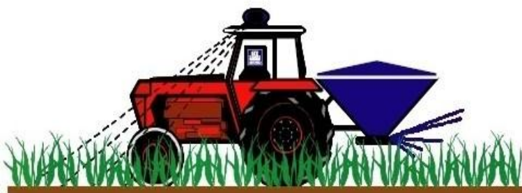
Slika 3. N-senzor (klorofilometar) za regulaciju doze N-prihrane usjeva

Od prije je bilo poznato da velićina labilne pričuve ( pool ) organske tvari tla može biti pouzdan prediktor prinosa kukuruza, ali su takvi testovi (npr. utvrđivanje mikrobne biomase i frakcija organske tvari tla) dugotrajni i skupi. Stoga je razvijena brza i jeftina metoda mjerenja labilne frakcija koja uključuje mineralizaciju ugljika i dušika, a osjetljiva je na kratkoroćne sezonske promjene. Nova metoda egzaktno je provjerena u uvjetima razlićitog managementa (konvencionalni, integrirani i kompostiranje) i u rotaciji s dva usjeva ( monokultura kukuruza bez pokrovnih usjeva i dvopolje kukuruz i soja-pšenica s pokrovnim usjevima ). Budući da su mineralizirani dušik i ugljik nastali mikrobioloćkom aktivnoću, utvrđena je vrsta i populacija mikroorganizama razaraća organske tvari.