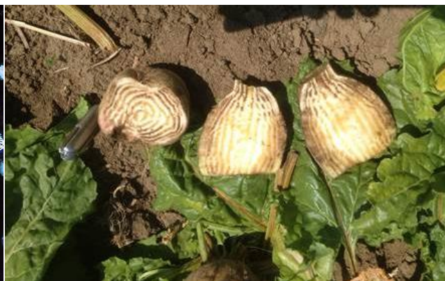
Slika 3. Presjeci šećerne repe nožem na terenu

Jasno je kako je uzrok totalne štete na šećernoj repi bila masivna embolija, ali ne zato što su sprovodni sudovi začepljeni, već što je komunikacija prema njima presječena nepoznatom, općeprisutnom crveno smeđom tvari koja čini barijeru (Slika 2.). Budući kako u floemu nisu zapaženi kalozni čepovi, ali je primjetna površinski smještena ista crveno-smeđa tvar, vrlo vjerojatno za probleme nije odgovoran nedostatak bora, odnosno visok pH kakav je čest na tom području.