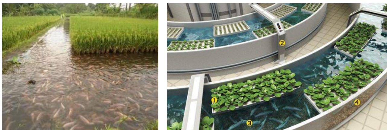
Slika 3. Akvaponski uzgoj biljaka i riba u samo reciklirajućem sustavu

Jedna od novijih, brzo rastućih metoda uzgoja zelenih biljaka je hidroponski uzgoj u kojem se koriste otopljene hranjive tvari u vodi, a biljke mogu biti pričvršćene na inertni supstrat ili na posebnim nosačima. Budući da gusto naseljena gradska područja oskudijevaju u poljoprivrednim površinama, moraju se osloniti na dovoz/uvoz iz udaljenih poljoprivrednih regija, posebno zelenog/svježeg povrća. Stoga su neke velike firme počele uzgoj povrća unutar velikih gradskih područja, npr. u Singapuru tvrtka Panasonic proizvodi povrće, u Dubaiju Sharp uzgaja jagode, dok širom Japana Sony, Toshiba i Fujitsu u svojim starim pogonima za proizvodnju poluvodiča uzgajaju salatu. Uzgoj