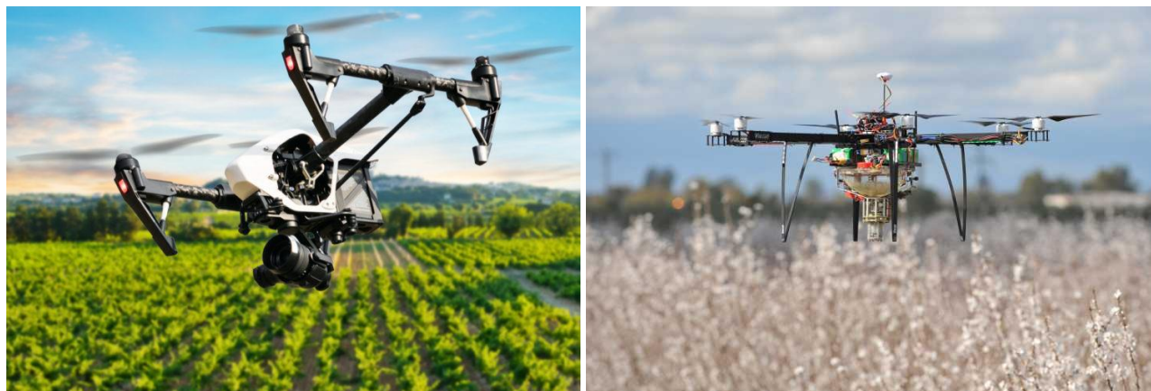
Slika 2. Primjena dronova u poljoprivredi

Suvremeni dronovi polijeću vertikalno, lete na malim visinama, tik iznad usjeva, opremljeni su različitim sensorima, radarima i kamerama visoke rezolucije te sofisticiranim softverom, uključujući i AI (umjetnu inteligenciju). Stoga mogu u realnom vremenu pouzdano procijeniti stanje usjeva i odrediti učinkovitu strategiju gnojidbe ili zaštite usjeva, potrebi navodnjavanja, potrebu za popravkama tla itd., čime se smanjuje oslanjanje na primjenu agrokemikalija i povećavaju prinosi (Slika 2., lijevo).