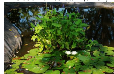
Nymphaea odorata (18 00 -20 00 )