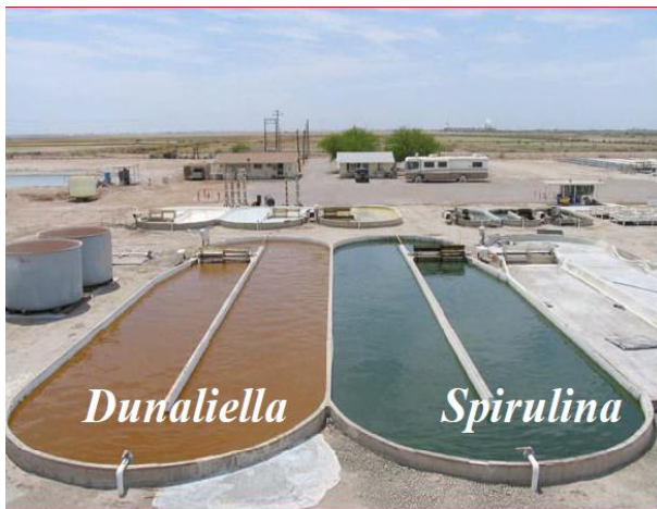
Slika 3. Eksperiment s uzgojem „uljnih“ algi (Mendola, D. (2011): The Future for Algae Crops in the Imperial Valley )

neće degradirati poljoprivredno zemljište, već može poboljšati kvalitetu tla pod intenzivnom poljoprivrednom proizvodnjom. Naime, duboko korijenje energetskih usjeva poboljšava strukturu i povećava sadržaj humusa, a tlo je zbog specifične agrotehnike i njege pošteđeno od onečišćenja gnojivima, pesticidima zbijanja i erozije. Višegodišnji energetski usjev je raznolikije stanište od jednogodišnjih usjeva, privlači različite vrste ptica, oprašivača i drugih korisnih insekata, a podržava i njihovu veću populaciju. U posljednje vrijeme i kod nas je sve češći uzgoj brzorastućih drvnih vrsta, najčešće paulovnije ( Paulownia elongata ) po hektaru za 3 god.