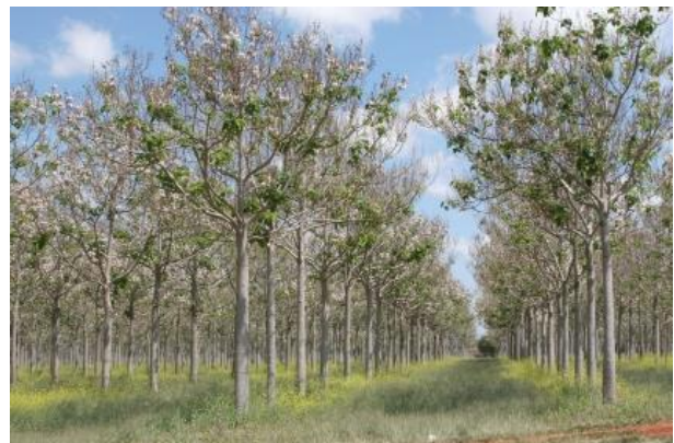
Slika 4. Paulownia elongata

Međutim, glavni problem proizvodnje bioetanola iz celuloze nije samo ekonomski već tehnološki, ali i taktičko-politički. Naime, celuloza je u prirodi uvijek povezana s ligninom i hemicelulozom što jako snižava učinkovitost fermentacije. Lignin se mora ukloniti, kemijskom obradom, a enzimatska razgradnja hemiceluloze (polisaharidni heteropolimer koji sadrži i 5C šećere) još uvijek nije moguća.