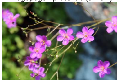
Phemeranthus teretifolius (14 00 )