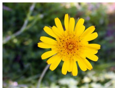
Tragopogon pratensis (3 00 -5 00 )