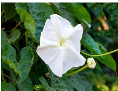
Ipomoea alba (2 00 )