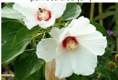
Hibiscus moscheutos (9 00 -11 00 )