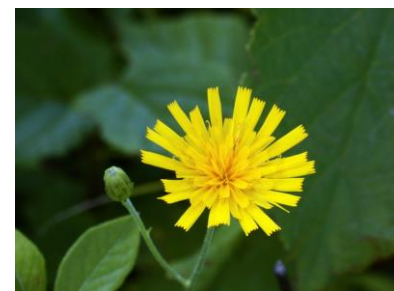
Hieracium umbellatum (6 00 -8 00 )