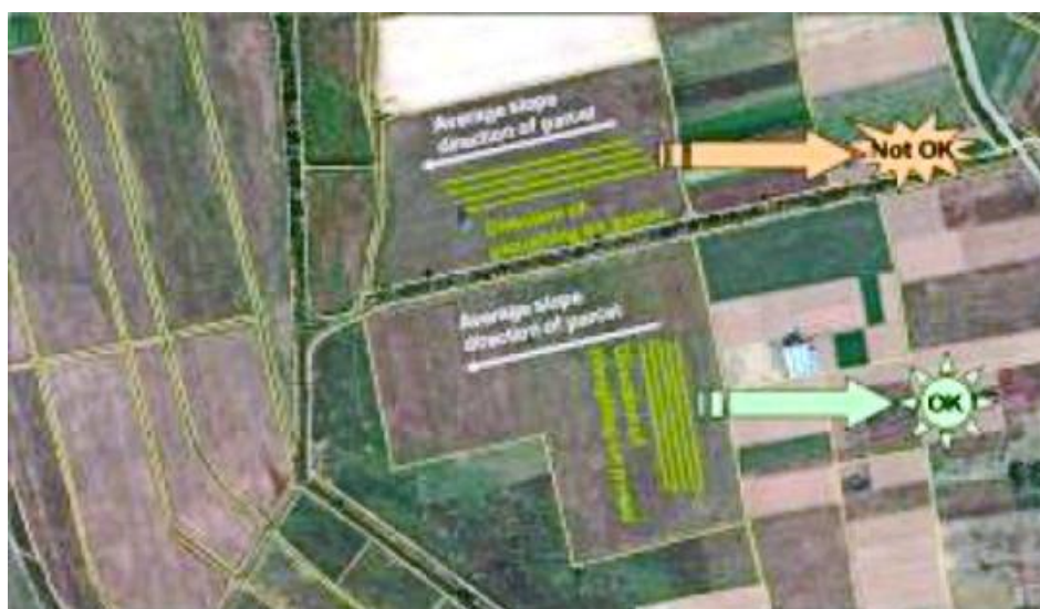
Slika 3. Prepoznavanje nagiba, smjera obrade i sjetve pomoću satelita.

Sukladno dobroj poljoprivrednoj praksi i stanju okoliša, poljoprivrednici na nagnutim terenima moraju obrađivati tlo i sijati paralelno s izohipsama kako bi se izbjegla pojava erozije na nagnutim parcelama. Smatra se da kod nagiba 3-7° obrada i sjetva moraju biti paralelni s izohipsama, kad je nagib 7-15° potrebne su terase, uglavnom za drvenaste kulture, a na većim nagibima treba uzgajati permanentne travnjake ili šume.