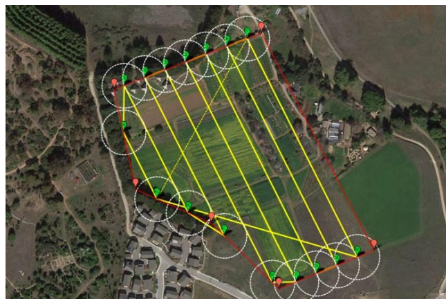
Slika 4. Programirani plan leta drona

Dronovi namijenjeni komercijalnom korištenju u poljoprivredi najčešće se nabavljaju s računalnim programima za analizu prikupljenih podataka i automatsko planiranje leta (Slika 4.). Standardnu opremu sačinjavaju GPS, digitalna kamera (fotoapararat) s multispektralnim sensorima, dok skuplji modeli često imaju i druge senzore, npr., infracrvene (toplinske), senzore hiperspektralnog (oku nevidljivog) zračenja, optički radar (LIDAR = Light Detecting and Ranging ), 3D radar (SAR = Synthetic Aperture Radars ) itd.