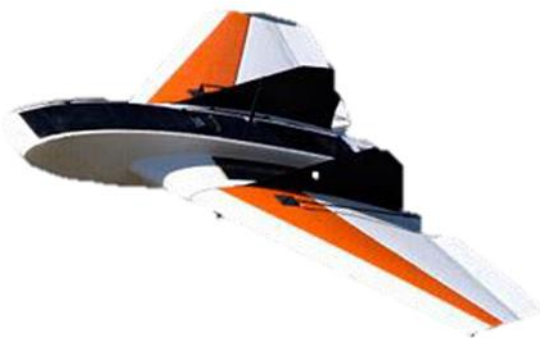
Slika 1. Tipičan izgled više rotorskog mikrodrona (lijevo) i zrakoplovnog (desno) opremljenih GPS-om, kamerama i drugim sensorima

Uz pomoć GPS-a dron (bespilotna letjelica ili UAV = Unmanned Aerial Vehicle ) može brzo i učinkovito kartirati cijelu farmu ili proizvodno područje, pronaći štetnike, pojavu bolesti, nedostatak vlage itd. i to na točnim lokacijama te omogućiti pravovremenu i brzu reakciju što može drastično racionalizirati i smanjiti troškove proizvodnje, uključujući i broj potrebnih radnika. Za redovito praćenje/izviđanje stanja usjeva koriste se mali i jeftini dronovi uz čiju pomoć poljoprivrednik ima širok pogled iz ptičje perspektive, ali i krupne kadrove koji se ne mogu postići iz satelita i zrakoplova. Dakle, ako se pri pregledu usjeva uoči problem, može se fotografirati i utvrditi njegova točna pozicija. Slijedeći korak je kartiranje, odnosno kreiranje digitalne slike proizvodne površine koja se uobičajeno vizualizira GIS alatima (geografski informacijski sustav; tzv. pametne karte). Kad se snimanje obavlja s više kamera u različitim dijelovima sunčevog spektra, može se obradom fotografija relativno pouzdano procijeniti stanje usjeva (Slika 2.),