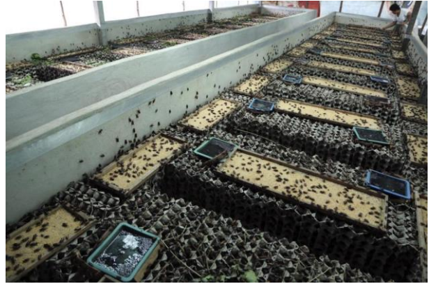
Slika 2. Farme jestivih insekata

Alge, posebice autotrofne alge koje posjeduju klorofil i obavljaju fotosintezu, mogu biti također izvrstan izvor hrane za ljude i životinje i rješenje za globalni nedostatak hrane. Budući da se alge mogu uzgajati u slatkoj vodi, morima i oceanima, a neke vrste zahtijevaju malo svjetlosti pa uspijevaju i do 200 m dubine, praktički je neograničen proizvodni prostor. Također, alge mogu biti sirovina za proizvodnju biogoriva što bi smanjilo potrebu korištenja fosilnih goriva kao i korištenje kopnenih biljaka u proizvodnji biodizela i bioplina. Smatra se da na Zemlji živi ~10.000 vrsta algi, a kao hrana koristi se tek 30-ak vrsta crvenih, smeđih ili zelenih algi.