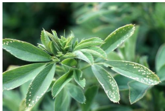
Slika 2. Simptom deficita kalija lucerne

U četverogodišnjem poljskom pokusu (Madison, SAD, 2019.) s osam kultivara lucerne i pet različitih doza kalija utvrđeno je da više kalija povećava prinos lucerne, ali uz nižu kakvoću krme i veću koncentraciju suhoj tvari , a iznošenje kalija prinosom kretalo se između 167 i 268 kg K ha -1 god. -1 . Također, važan zaključak istraživanja je da prinos lucerne raste s porastom doze kalija, ali samo unutar preporučenih granica, no luksuzna gnojidba kalijem neće produžiti životni vijek lucerne ili produktivnost nakon treće proizvodne godine. Budući da je raspoloživost kalija ovisna o teksturi tla i vrsti glinenih minerala, vlazi i drugim faktorima okoliša, potrebnu dozu kalija uvijek treba utvrditi temeljem kemijske analize tla i očekivane visine prinosa, ali uz uvažavanje kompromisa ako je lucerna namijenjena hranidbi krava. Kad je suviše raspoloživog kalija u tlu, tada se malo može učiniti za smanjenje njegov usvajanja, a prvi je korak kemijska analiza tla te analiza krme na koncentraciju kalcij. Kemijsku analizu tla poželjno je učiniti svakih 3 - 5 godine, jer u intenzivnoj biljnoj proizvodnji kaliofilnih biljaka, posebice na lakšim tlima i uz navodnjavanje, lako dolazi do pada raspoloživosti kalija (Slika