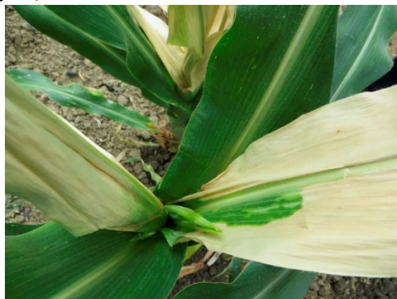
Slika 5. Nedostatak Zn na kukuruzu na solođu, Marijanci, 2016.