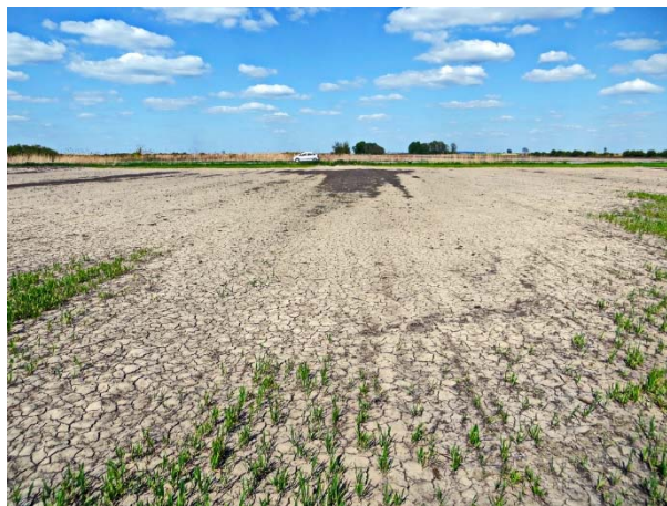
Slika 3. Solonjec, Čelije 2015.

Brzina djelovanja različitih materijala za kalcizaciju (vapno, kalcijev karbonat, dolomit, karbokalk i dr.) ovisi o njihovoj topljivosti, veličini čestica i količini vlage u tlu. S obzirom na to da sitnija granulacija kalcizacijskog materijala znatno povećava kontaktnu površinu s česticama tla i reakcija tla je brža. Tako materijal granulacije manje od \phi \leq 0,25 mm (60 mesh) djeluje u roku od 30 dana. S porastom veličine čestica brzina otapanja se usporava, pa se one promjera 0,60 - 0,25 mm otapaju za 1 do 2 godine, dok se čestice između 2,36 - 0,60 mm otapaju u tlu do pet godina. Zbog toga se krupnozrnati materijali smatraju kad je \phi čestica \geq 2,00 mm (10 mesh ili manje). Promjer čestica karbokalka, kakav isporučuju naše šećerane, je ispod 0,425 mm (40 mesh) te njihovo otapanje u tlu s dovoljno vlage potraje i nekoliko mjeseci, a djelovanje na pH-vrijednost tla ne prelazi 3 - 5 godina pa kalcizaciju treba ponoviti, obvezno nakon kemijske analize tla.