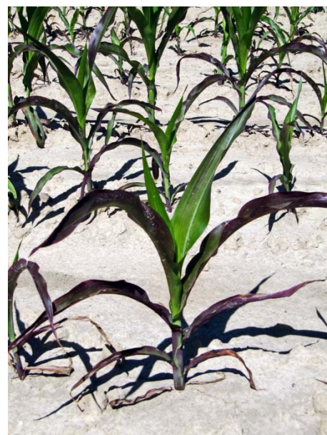
Slika 2. Bestrukturano, ekstremno kiselo tlo, Bocanjevci 2011.

Rezultati istraživanja u SAD-u su pokazali da je gipsanje najviše koristilo lucerni pa je prinos bio dramatično povećan. Na uloženi 1 $ povrat je bio 5 $, a kod kukuruza 2 $. Također, izvrsni rezultati su bili i na drugim usjevima (soja, pšenica i dr.). Odgovor je u činjenici da je, nakon primjene gipsa, bolje usvajanje drugih hraniva, uključujući dušik, fosfor i kalij, povećalo otpornost usjeva na sušu te je povećanje prinosa usjeva samo dio utjecaja primjene gipsa (i fosfogipsa). Također, gips može poslužiti za stabilizaciju fosfora u tlu, odnosno spriječiti njegovo ispiranje i kemijsku fiksaciju u tlu te ukloniti manjak fosfora i toksične efekte aluminija jasno vidljive na slici 2.