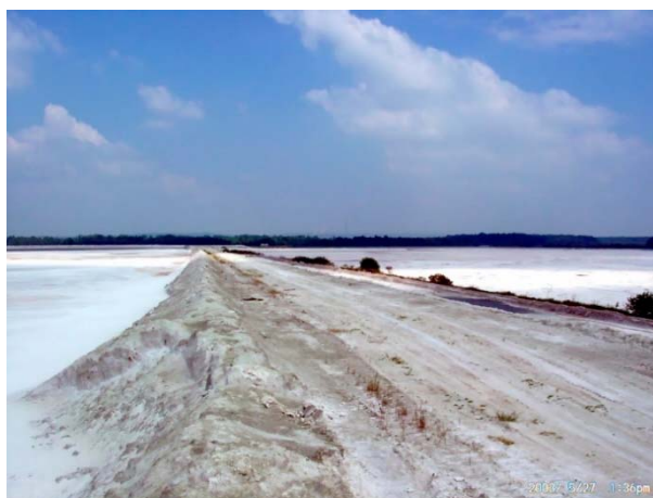
Slika 1. Deponija fosfogipsa u Lonjskom polju 2003. god. (foto Vladimir Vukadinović)

U Hrvatskoj je do sada provedeno nekoliko znanstvenih istraživanja, ali samo primjene fosfogipsa kao poboljšivača tla i to s namjerom smanjenja deponija tvornice gnojiva Petrokemija d.d. u Lonjskom polju (~4,5 milijuna tona fosfogipsa). Naime, fosfogips je industrijski nusproizvod ( NUS-79 , Očevidnik