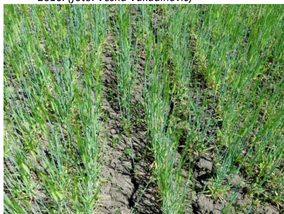
Slika 7. Slab porast pšenice na solonjecu, Bobota, 2015.