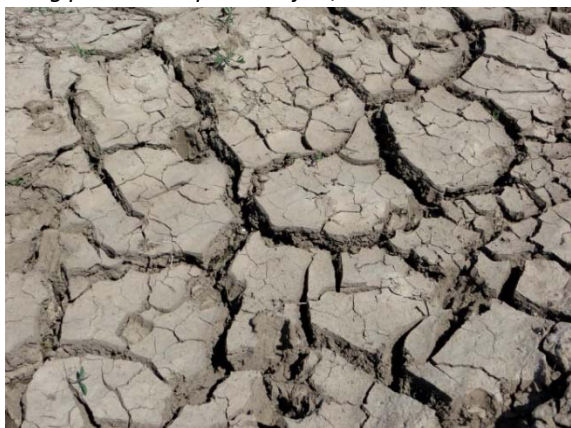
Slika 4. Pokorica na solonjecu, Čelije 2015.

Kako je molekularna masa bezvodnog gipsa (CaSO 4 ) = 136 g mol -1 , a prirodnog gipsa (CaSO 4 × 2 H 2 O) = 172 g mol -1 , potreba gipsa za 1 ha površine je 2,04 \times 3.000.000 = 6.120.000 \text{ g} ili 6,12 t CaSO 4 ha -1