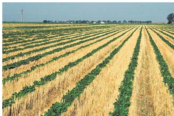
Slika 2. Uzgoj usjeva u no-tillage sustavu obrade tla (gore: sjetva; dolje: izgled usjeva soje; Iowa, USDA)