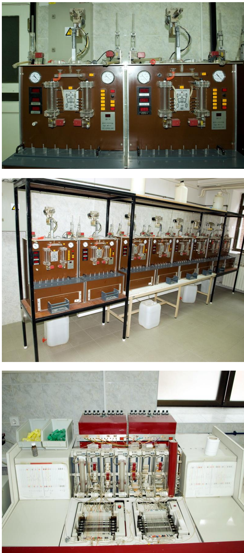
Slika 2. Izgled EUF ekstraktora i višenakanlnog spektrofotometra